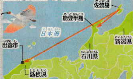
羽のピンク色が美しいトキ。朱鷺色とも呼ばれる (2024年10月、佐渡島で)